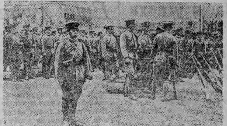
Отряд студентов японской военной академии, отправляющийся из Токио в Манчжоу-го